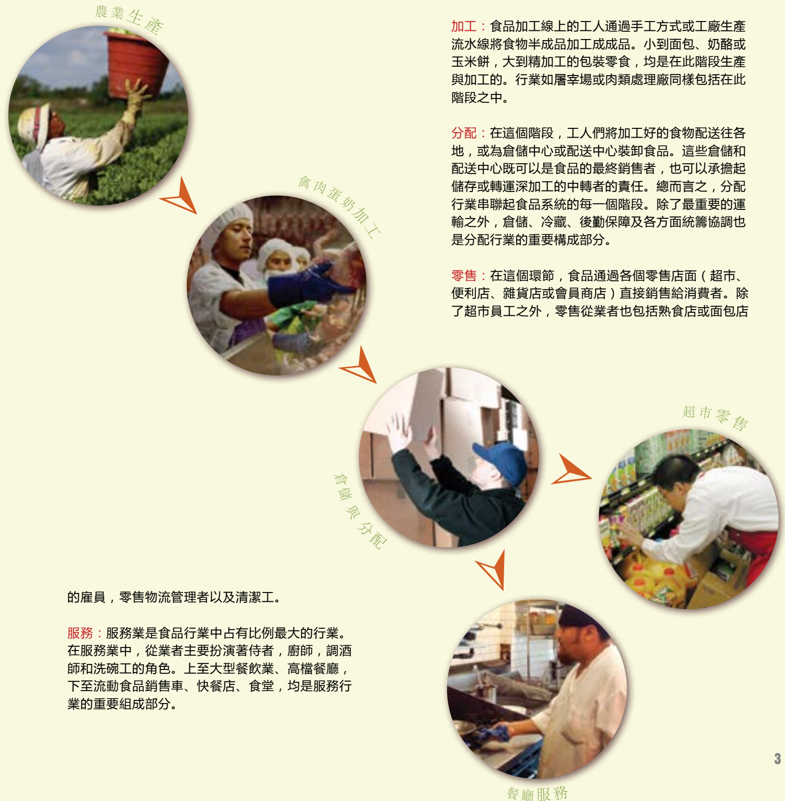
Fig.1 各個階段的食品系統工人