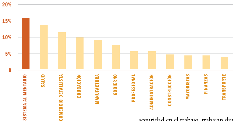
Fig.2 TRABAJADORES DEL SISTEMA ALIMENTARIO COMO PORCENTAJE DE LA FUERZA LABORAL DE EE.UU. EN EL 2010.